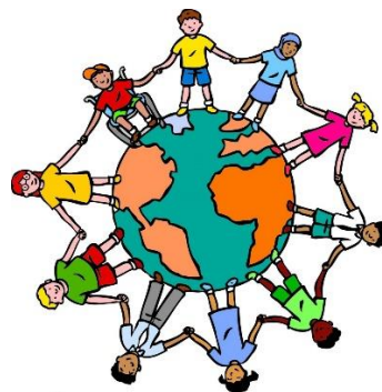
We zijn allemaal anders

Voornoemd thema richt zich op het bevorderen van respect en waardering voor diversiteit in de klas en daarbuiten. Het doel is om leerlingen bewust te maken van de verschillen tussen mensen en hoe deze verschillen bijdragen aan een rijke en dynamische samenleving. Leerlingen leren over verschillende achtergronden, culturen, religies en gewoonten en er wordt aandacht besteed aan individuele verschillen zoals interesses, talenten en voorkeuren. Leerlingen ontwikkelen daardoor een houding van openheid en nieuwsgierigheid tegenover mensen die anders zijn dan zichzelf. Het bevordert respect voor diversiteit in de klas en de samenleving.